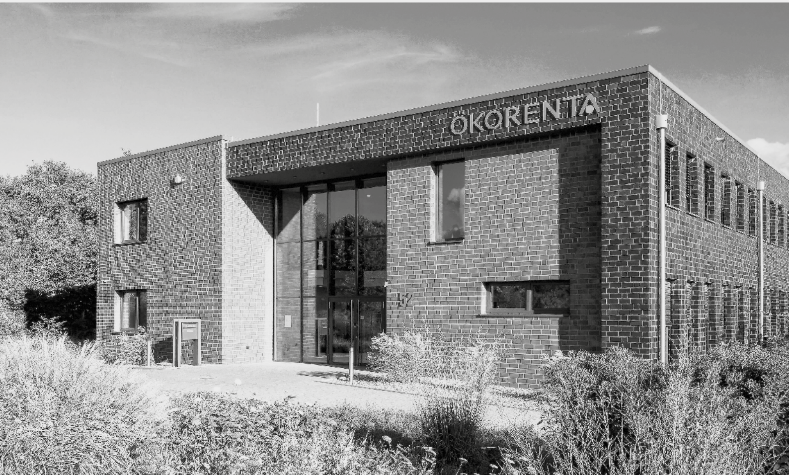
ÖKORENTA Firmengebäude am Hauptsitz in Aurich, Ostfriesland