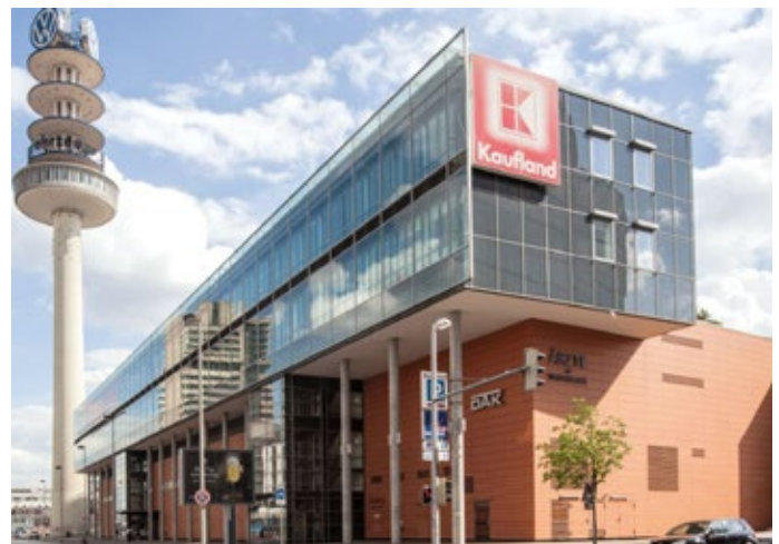
Die FIM Unternehmensgruppe vermietet an Kaufland, Lidl, Rewe und andere namhafte Handelsfirmen.

Dieses führt zu Einkaufspreisen, welche auch Mitbewerber staunen lassen.